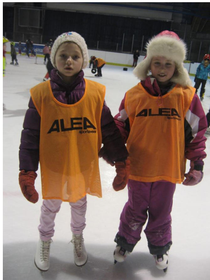
No, kluci, to tedy je!