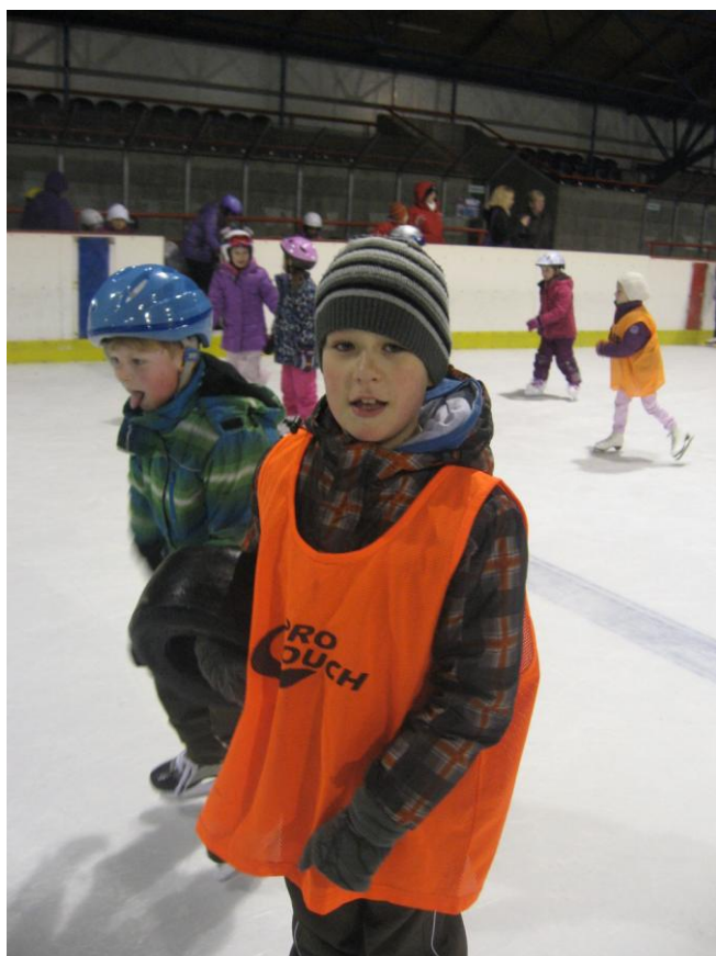
Páni!, to je námaha...

Děti získaly na obratnosti, posílily svoje sebevědomí, neboť obrovské posuny k lepšímu byly ve výkonech na bruslích více než viditelné.